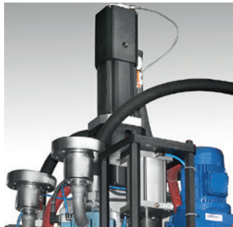
Imbutitore servo-assistito. Plug-assist device.