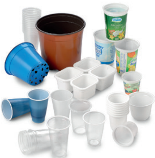
Ideale per bicchieri, contenitori tronco-conici, vaschette. Suitable for cups, conical containers, trays.